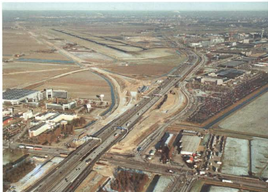
Toekomstig knooppunt De Hoek (aansluiting A5 op A4)